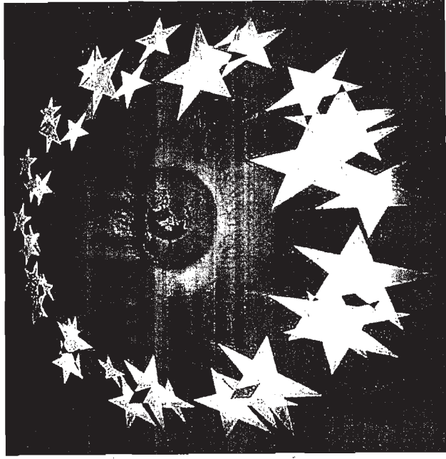
Cervia fa scuola al seminario "Europrogettazione"

CERVIA - Al wine bar Just, sul lungomare di Cervia, continuano gli appuntamenti dedicati al vino. Domani, dalle 19 alle 21, sarà la volta dell'Umbria e si degusteranno il Greccante ed il Rosso di Montefalco. Con l'ausilio di immagini si potrà viaggiare nelle caudate umbrine, il buffet proporrà prodotti tipici.